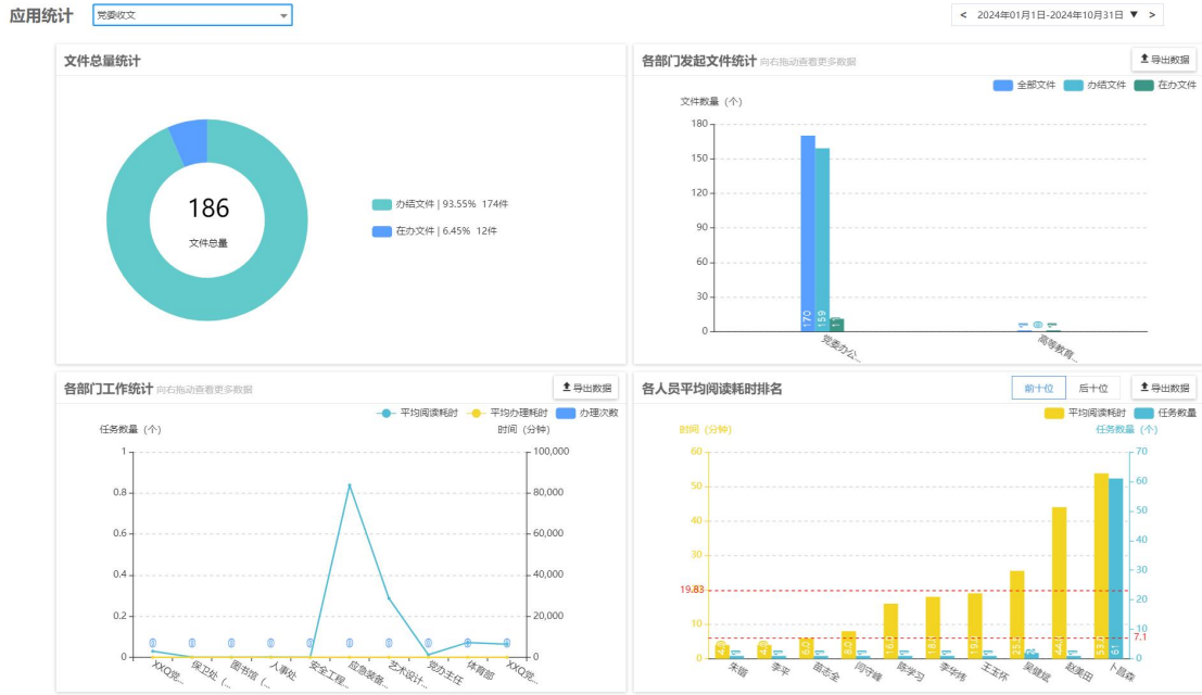
图 2 OA 系统党委收文数据统计