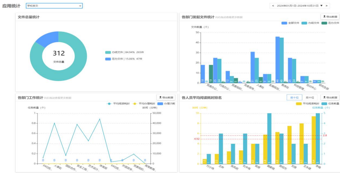
图 1 OA 系统校内发文数据统计

2023-2024 学年，学校主要通过信息公开专栏、学校官方网站、学校门户网站、校报校刊、宣传栏、微信官方平台、微博等多种方式公开学校信息。本学年通过信息公开专栏发布信息 41 条；学校新闻网发布信息 467 条（其中头条关注 142 条，综合新闻 128，华科快讯 167 条，媒体华科 9 条，通知公告和华科大讲堂 21 条）；应大新闻网发布信息 118 条（其中头条关注 19 条，综合新闻 86 条，通知公告 6 条，学术讲座 7 条）；党纪学习教育专题网站发布信息 88 条（其中头条 3 条，上级精神 6 条，学校要闻 15 条，基层动态 36 条，宣传简报 13 条，学习资料 15 条，大图 1 副）；门户网站发布各类通知公告 406 条，办公自动化系统发布文件 312 件。