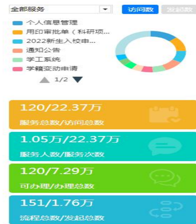
图 4 学校信息门户数据统计